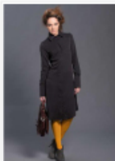
Diseño de la colección otoño/invierno 2011 de Sara Coleman