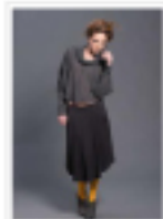
Falda plisada de Sara Coleman. Otoño/invierno 2011-12

Colección otoño/invierno 2011-12 de Sara Coleman 7 fotos