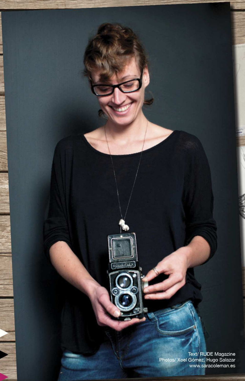
Text/ RUDE Magazine www.saracoleman.es